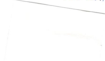
Zuzana Bronišová Cycling Academy Trenčín, o.z.